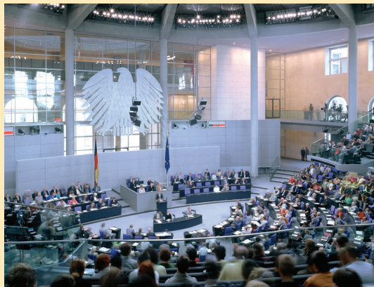
Informationen des Bundeswahlleiters