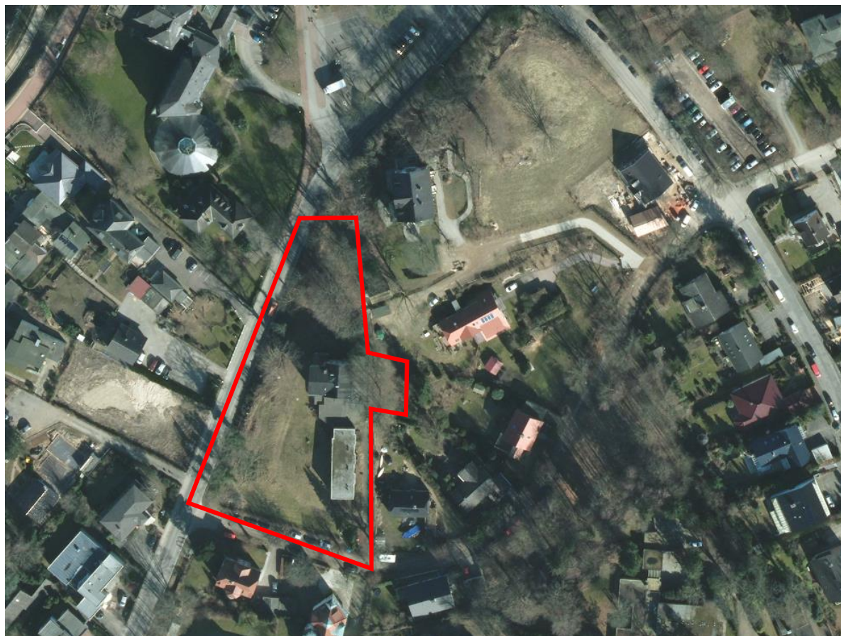
Abb.: Digitaler Atlas Nord

Grundstücksbereich bestehen Gehölz und sonstige Einzelbäume. Auf dem Gelände befindet ein Gebäude mit bis zu drei Vollgeschossen. Das Areal ist durch eine bewegte Topografie - die zur Plöner Straße hin abfällt - gekennzeichnet.