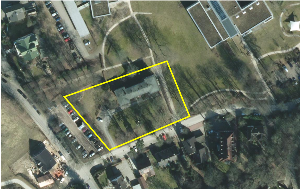
Abb.: Digitaler Atlas Nord

Das Plangebiet befindet sich im südlichen Ortsteil von Bad Malente-Gremsmühlen, östlich des Dieksees. Im Süden bildet der Olandsweg mit dem bestehenden Gehölzbestand die Begrenzung des zu beplanenden Bereiches. Westlich davon befindet sich die Frahmsallee und zwischen dieser und dem Plangebiet besteht ein PKW-Parkplatz. Im Norden und Osten schließen sich an den Planbereich die parkartigen Flächen des Klinikgeländes an. Auf dem Grundstück besteht ein zweigeschossiges Wohnhaus mit flach geneigtem Dach, wobei das Kellergeschoss aus dem topografisch bewegten Gelände teilweise herausragt.