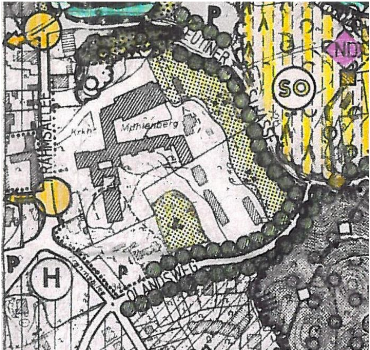
Abb.: Auszug aus dem Landschaftsplan der Gemeinde Malente 1999

Für das Plangebiet gelten die Festsetzungen des Bebauungsplanes Nr. 51b, 4. Änderung aus dem Jahr 2003. Dieser weist für das Plangebiet ein Sondergebiet Klinikum nach § 11 BauNVO aus. Innerhalb des Sondergebietes sind neben Nutzungen, die der medizinischen Versorgung, Krankenpflege und Rehabilitation dienen, auch 10 Dienstwohnungen zulässig. Für das Klinikgebäude wird ein großzügiges Baufenster mit fünf und sechs Vollgeschossen und einer GRZ von 0,3 zugelassen. Für das Wohngebäude wird ein kleineres Baufenster mit max. zwei Vollgeschossen und einer GRZ von 0,3 ausgewiesen.