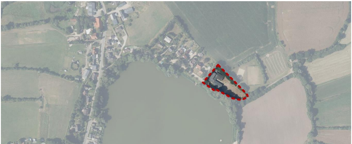
Abb.: Luftbild

Das Plangebiet befindet sich an der Nordostseite des Neukirchener Sees und bildet den Abschluss der zusammenhängenden Bebauung an der Straße „Seeweg“. Das Feriencamp wird im Norden durch eine Böschung mit Gehölzaufwuchs von den nördlich dahinterliegenden Sport- und Freizeitflächen abgeschirmt. Im Süden verläuft die Straße „Seeweg“ und bildet gleichzeitig auch die östliche Abgrenzung des Plangebiets. Auf der anderen Straßenseite